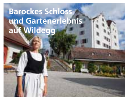
Barockes Schloss- und Gartenerlebnis auf Wildeg

Schloss Lenzburg – Museum Aargau 5600 Lenzburg, T 0848 871 200 schlosslenzburg@ag.ch www.ag.ch/lenzburg