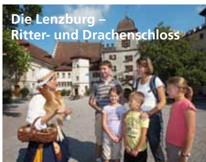
Die Lenzburg – Ritter- und Drachenschloss

Schloss Hallwyl – Museum Aargau 5707 Seengen, T 0848 871 200 schlosshallwyl@ag.ch www.schlosshallwyl.ch