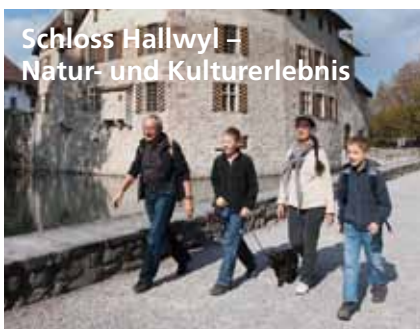
Schloss Hallwyl – Natur- und Kulturerlebnis

Ein Tal, zwei Seen, bezaubernde Landschaften, unverbaute Ufer und ein einzigartiges Alpenpanorama. Ob zu Fuss, mit dem Velo oder dem Schiff: das Seetal bietet eine Fülle von Möglichkeiten. Wir haben ein paar Highlights im Tal der Schlösser und Seen für Sie zusammengestellt.